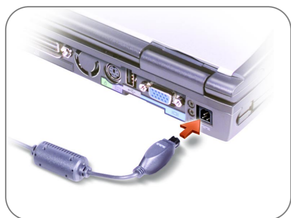
AC Adapter AC アダプタ 交流适配器