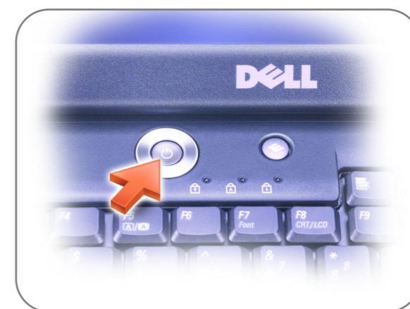
Power Button 電源ボタン 电源按钮