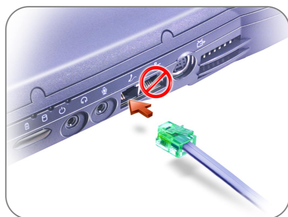
Modem Option モデムオプション 调制解调器选件