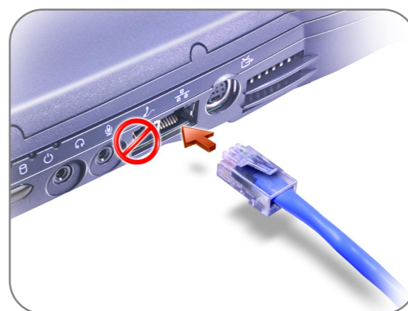
Network Option ネットワークオプション 网络选件